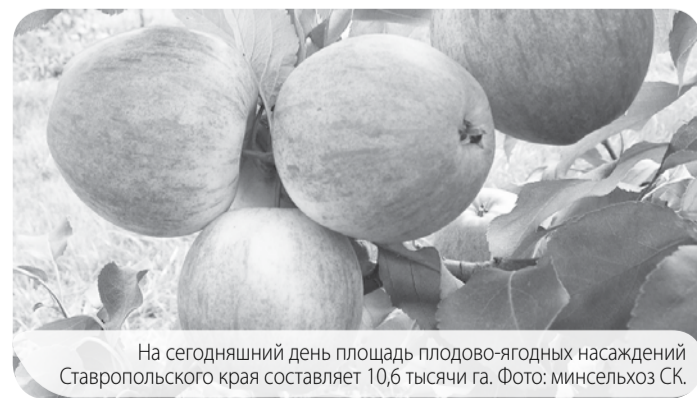
На сегодняшний день площадь плодово-ягодных насаждений Ставропольского края составляет 10,6 тысячи га.

Развитию подотрасли большое внимание уделяет губернатор Владимир Владимиров. В текущем году на поддержку садоводства в рамках реализации госпрограммы РФ «Развитие сельского хозяйства и регулирования рынков сельскохозяйственной